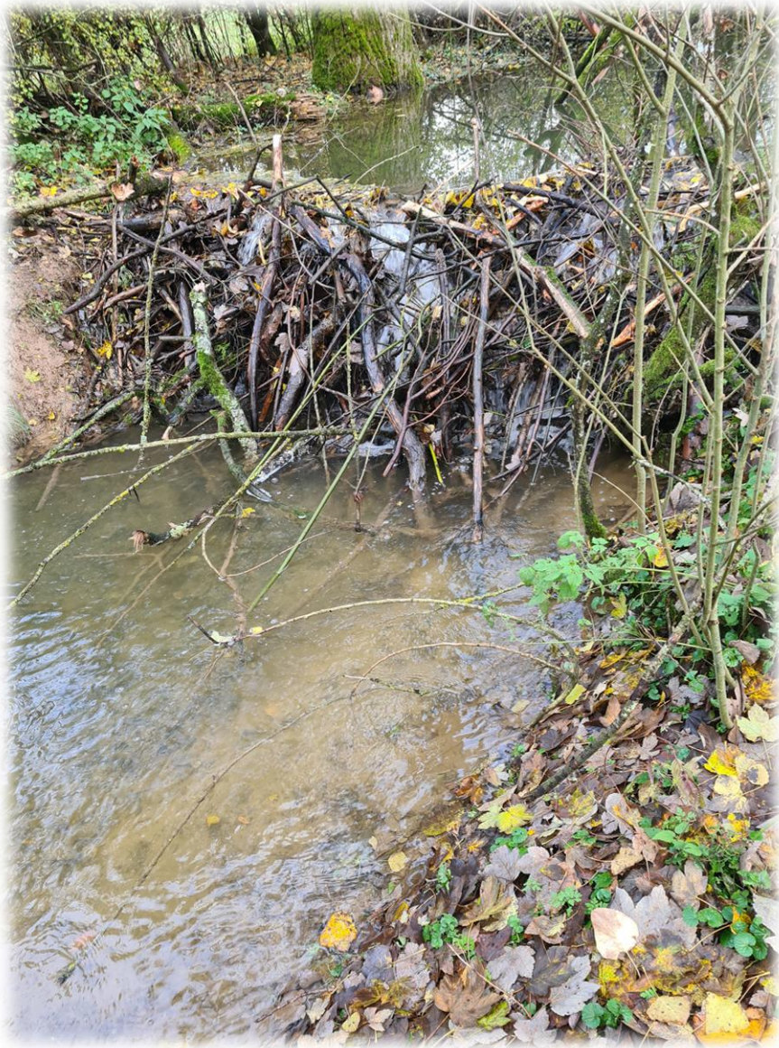
Barrage construit par des castors près des étangs de la commune